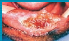
Câncer de lábio associado à exposição aos raios de sol.