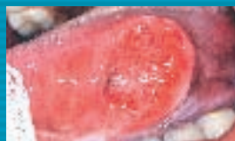
Úlcera indolor em borda de língua.