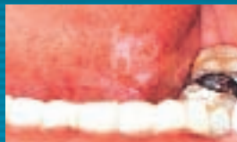
Pequenas lesões iniciais em assoalho.