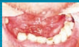
Úlceras em assoalho e gengiva.