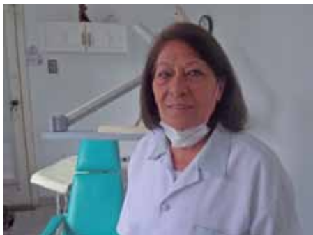
A doutora atende seus pacientes diariamente na Clínica localizada no Alto da XV.

chetes dos jornais. “Não só consegui que muitos perdessem o medo de ir ao dentista, mas também com que muitos largassem o vício do cigarro e outras drogas”, conta.