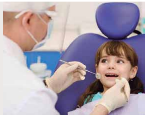
Além de identificar os sintomas, o guia orienta o CD a também encaminhar o caso.

O conteúdo também deu origem a um aplicativo com o mesmo nome, disponível para celulares com sistema Android pela Google Play. “Com o formato mobile, o objetivo foi disponibilizar as orientações de forma prática, fácil e gratuita”, ex-