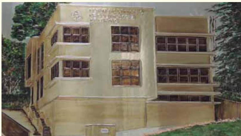
Desde janeiro o CRO/PR está inscrevendo os inadimplentes em serviços de proteção ao crédito.

Dessa forma, aqueles que possuem débitos devem entrar em contato com o Departamento Financeiro do Conselho para negociação, na Sede do CRO/PR, em Curitiba, e ou em uma das Delegacias regionais.