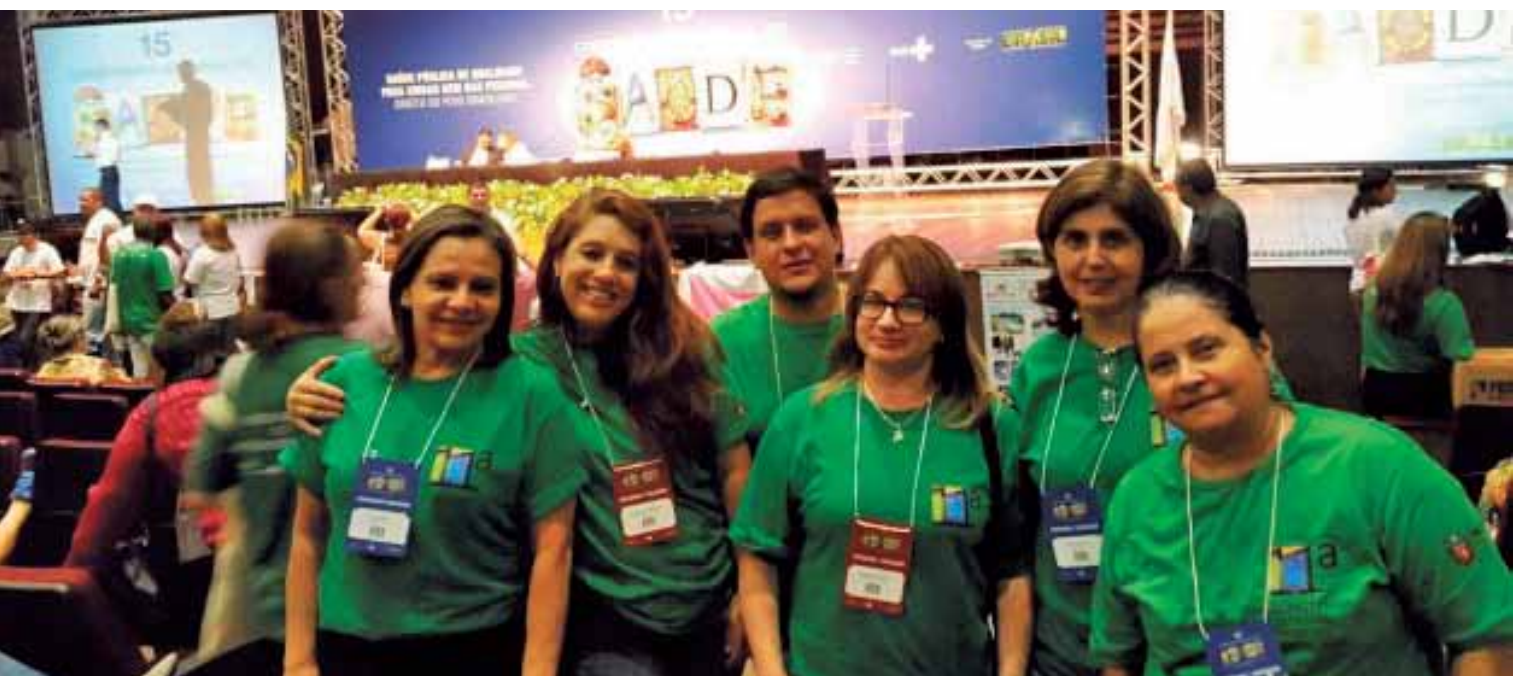
Os cirurgiões-dentistas do Paraná representaram o CRO/PR na 15. a Conferência Nacional de Saúde, realizada no período de 1. o a 4 de dezembro de 2015, em Brasília.

A 15. a CNS terminou com oito diretrizes, 40 proposições e 27 moções resultantes das discussões em 28 grupos de trabalho.