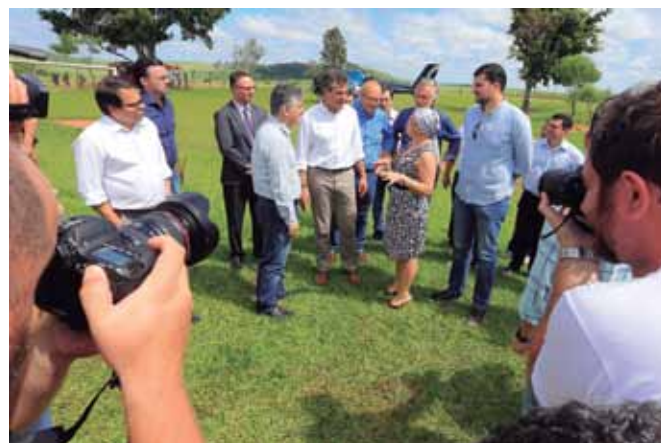
Pedra fundamental da clínica foi lançada em fevereiro.

O novo câmpus da Universidade Estadual do Norte do Paraná (Uenp), localizada em Jacarezinho, terá uma clínica Odontológica. A pedra fundamental foi lançada pelo governador Beto Richa, em fevereiro. “É uma importante conquista para a população do Norte Pioneiro, uma obra que trará mais desenvolvimento social para a região”, disse Richa.