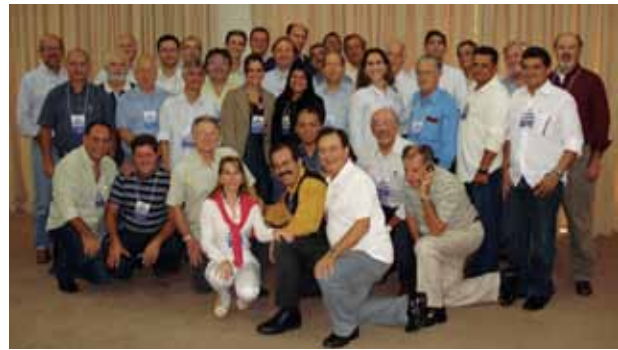
Presidentes de todos os Conselhos Regionais marcaram presença.

Durante os dias 5 e 6 de março foi realizado em Curitiba um encontro que contou com a participação dos presidentes dos CROs de todo o Brasil. O objetivo foi o de discutir a Lei 4.324, de abril de 1964, que instituiu o Conselho Federal de Odontologia (CFO) e os CROs. Na capital paranaense foi feita a finalização desses encontros, que foram realizados em diversos estados brasileiros. O documento final do encontro será encaminhado ao Conselho Federal de Odontologia e à sua procuradoria jurídica para conhecimento e, se necessário, as devidas alterações para posterior encaminhamento ao Congresso Nacional para os devidos trâmites.