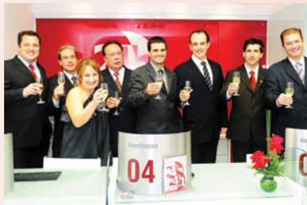
Integrantes do Conselho de Administração da Uniodonto Curitiba: uma grande festa.