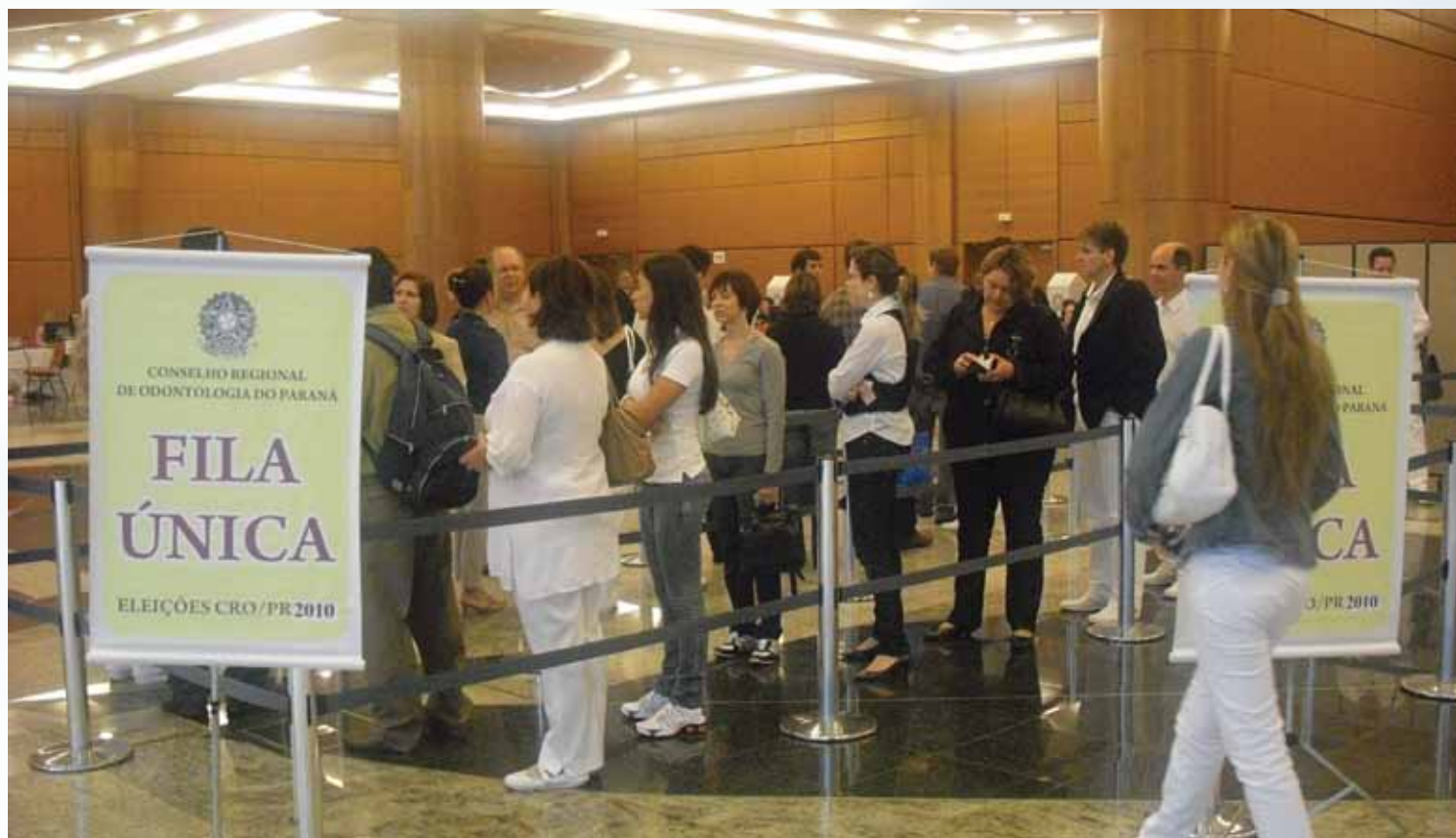
As eleições contaram com uma participação expressiva dos profissionais em todo o estado. Na capital a votação foi no Estação Embratel Convention Center.