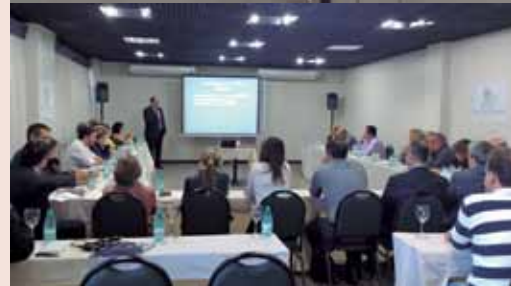
O Fórum, realizado em Foz do Iguaçu, teve a participação de cirurgiões-dentistas ligados ao CROs do Paraná, Santa Catarina e Rio Grande do Sul.