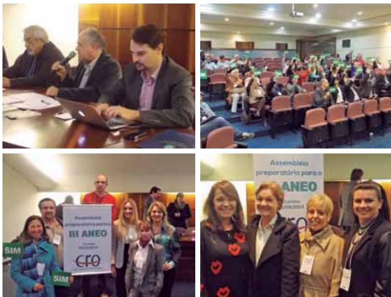
O resultado definido na assembleia realizada na sede da ABO-PR será levado para a assembleia nacional, que ocorrerá em outubro, em São Paulo.

Comissão de Ensino do CRO/PR se reúne para sistematizar resultados para assembleia da ANEO, em outubro.