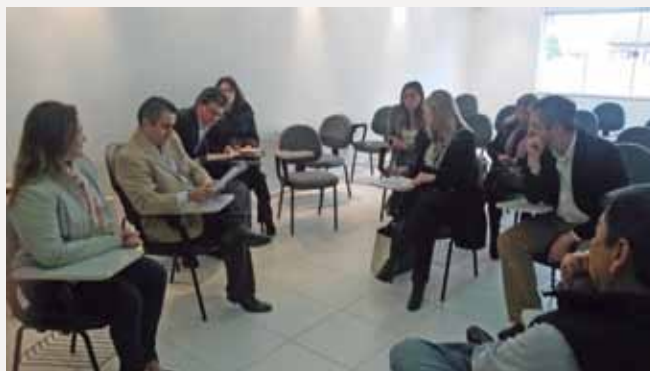
Reunião com prefeitura.