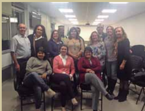
Mesa de negociação SUS.

Além do Soepar, outros nove sindicatos são membros do projeto: sindicato dos Servidores Municipais do Paraná (Fessmuc); das Assistentes Sociais do Paraná (Sindasp); dos Empregados em Estabelecimentos de Serviços da Saúde (Sindesc); dos Servidores do Estado da Saúde do Paraná (Sindisaúde); dos fisioterapeutas (Sinfito); dos fonoaudiólogos do Estado do Paraná (Sinfopar); dos Servidores Públicos Municipais de Curitiba (Sismuc); dos Médicos do Paraná (Simepar) e dos Agentes Comunitários de Saúde (Sindasc). ■