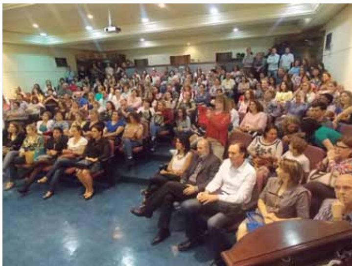
Assembleia na sede da ABO-PR, no dia 9 de setembro, discutiu o tema com os servidores da Saúde.