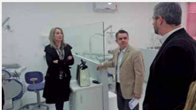
Reunião com prefeitura.

Diversos projetos foram discutidos e serão analisados para a formalização da parceria. Entre eles estão: atendimento de qualidade a população carente, formação de assistentes de clínicas odontológicas e a implantação do projeto de Incubadora Odontológica, pioneiro no país. ■