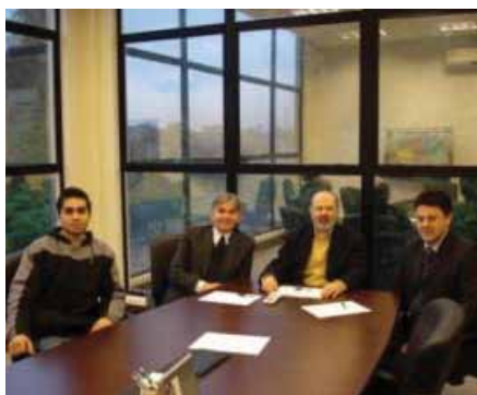
O deputado e assessores foram recebidos no CRO/PR.

Este elo pode colaborar na elaboração de novos projetos de leis que ampliem a rede de atendimento odontológico no Para-