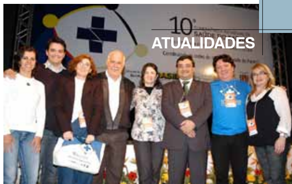
A 10.ª Conferência reuniu autoridades e especialistas, no mês de outubro.