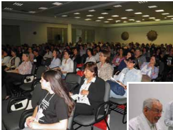
O auditório ficou lotado para o evento.

Em paralelo ao 8.º Encontro Sul Brasileiro de Odontopediatria foi realizado entre os dias 12 e 14 de outubro o 8.º Encontro Nacional de Odontologia para Bebês, na cidade de Jaraguá do Sul, em Santa Catarina. O objetivo foi tratar de cuidados especiais que devem ser tomados desde os primeiros meses de vida, para garantir a saúde bucal dos bebês.