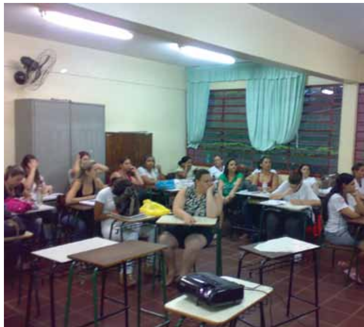
Em Maringá a palestra foi realizada no Colégio Estadual Santa Maria Gorete.