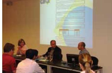
O treinamento foi realizado na sede do CRO/PR.