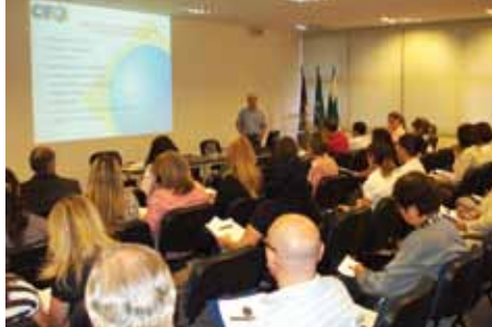
Mais de 50 pessoas participaram do treinamento.