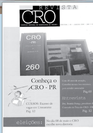
Capa da revista do CRO/PR, edição número 1.