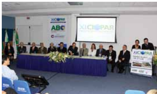
A solenidade de abertura contou com a presença de autoridades da área e parlamentares.