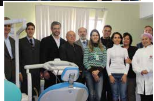
O consultório entregue pelo Brasil Sorridente irá beneficiar as pessoas atendidas na unidade.