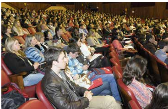
A terceira edição do Sul Brasileiro contou com quase 1.200 participantes.

Evento foi realizado nos dias 7 e 8 de novembro no Centro de Convenções de Curitiba