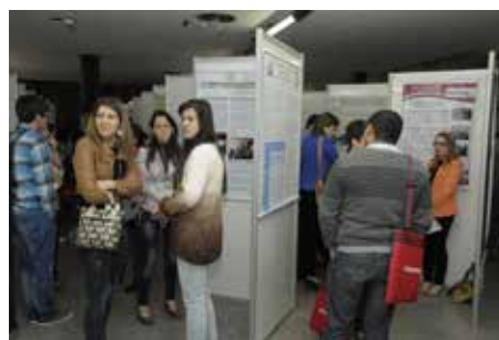
A área dos pôsteres recebeu grande número de visitantes.