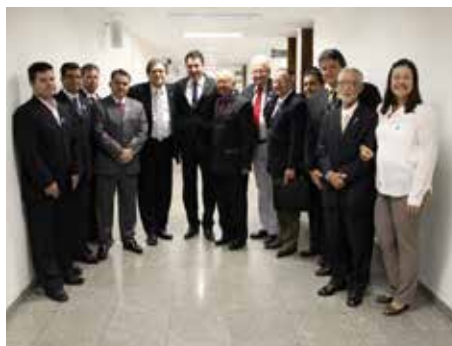
O trabalho do CFO e das entidades de classe no Senado contribuiu para derrubar emenda que retirava necessidade de CDs em UTIs.

Para Sérgio Souza, que foi relator da matéria na Comissão de Assuntos Sociais (CAS), especialmente os pacientes inter-