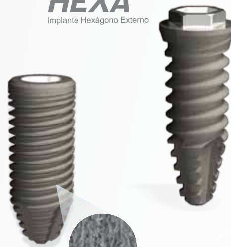
Superfície Speed ®