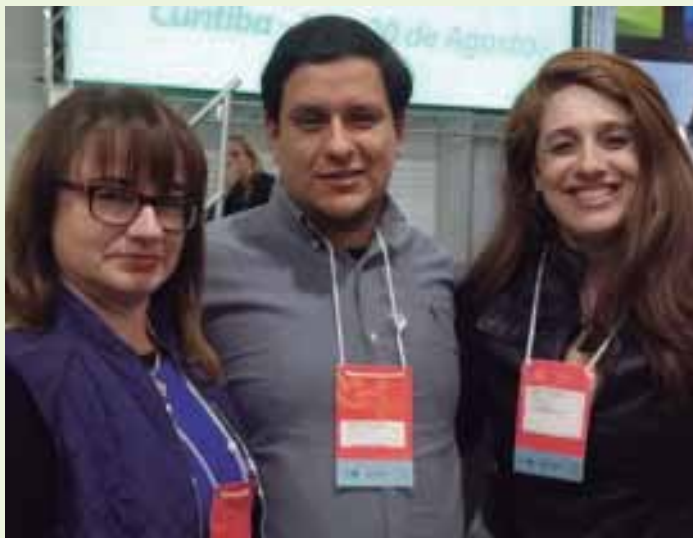
Os CDs que irão representar o CRO/PR na Conferência Nacional de Saúde.

eleitos pelas conferências de base, além 976 convidadas e convidados e 98 atores sociais por credenciamento livre, totalizando de 4.322 participantes.