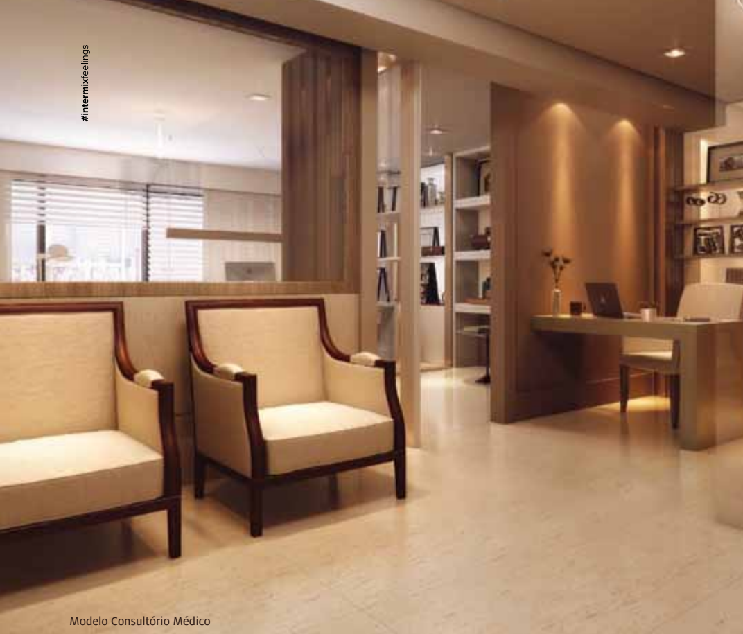
Modelo Consultório Médico