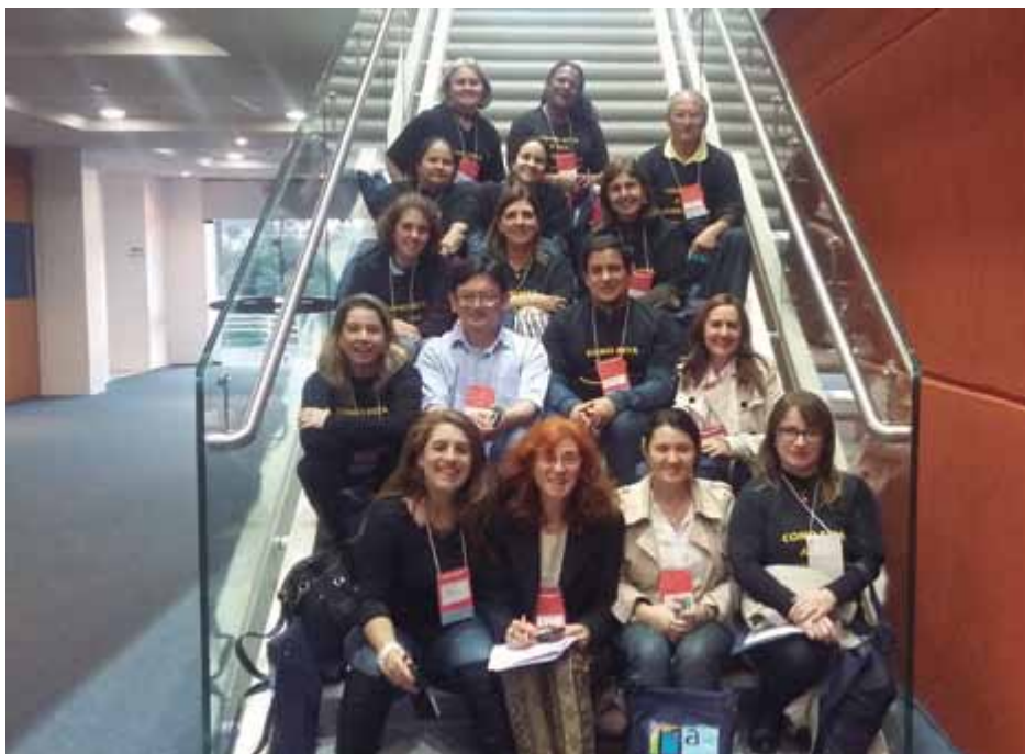
O grupo de cirurgiões-dentistas participou da Conferência Estadual de Saúde.

Na ocasião os participantes debateram e defenderam as políticas públicas de saúde do SUS.