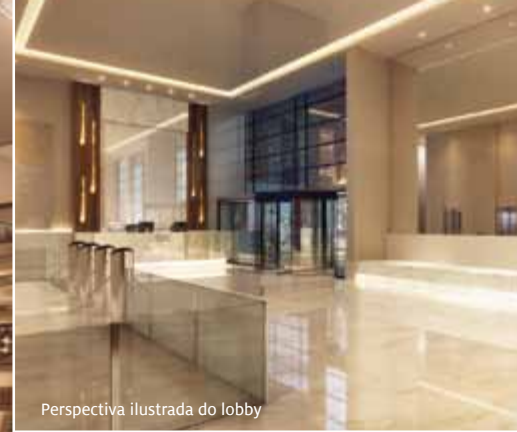
Perspectiva ilustrada do lobby

CONSULTE QUEM MAIS ENTENDE DE NEGÓCIOS. ESCOLHA O URBAN OFFICE.