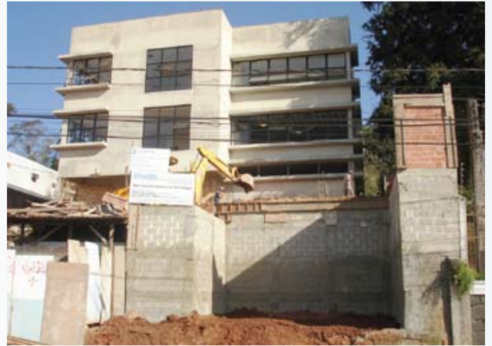
Os trabalhos de finalização das obras entram em ritmo acelerado para que tudo fique concluído até setembro.