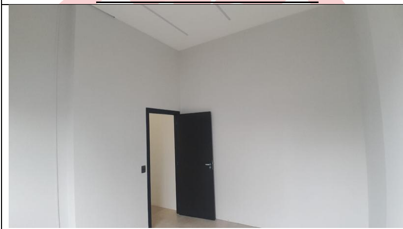
Sala VIP #1