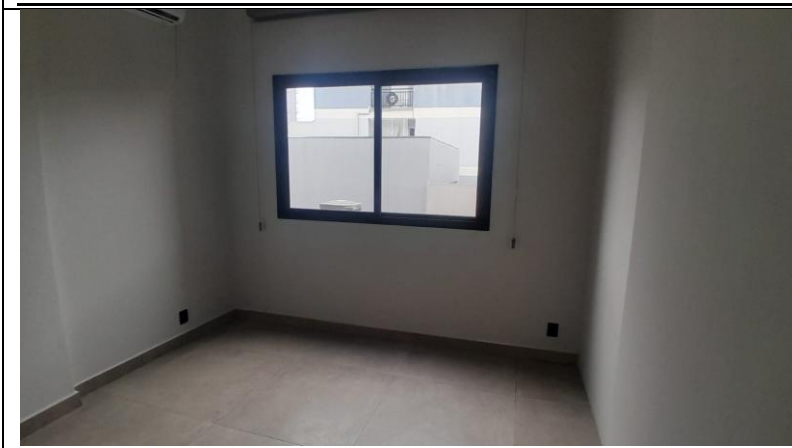
Sala VIP #2