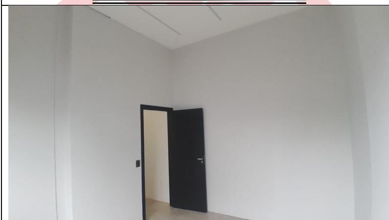
Sala VIP #1