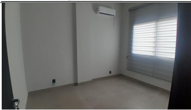
Sala VIP #2